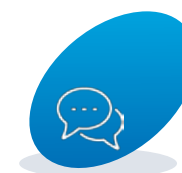
Spremni smo za saradnju